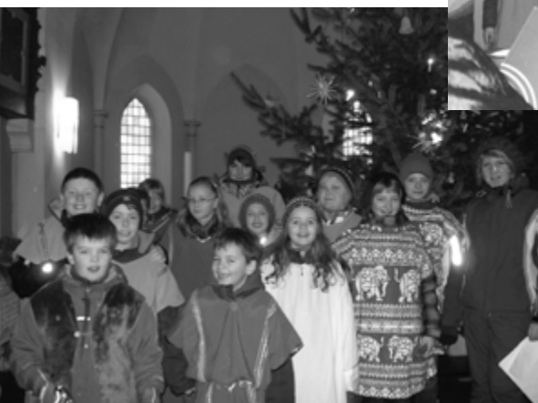
Krippenspiel in Ragösen